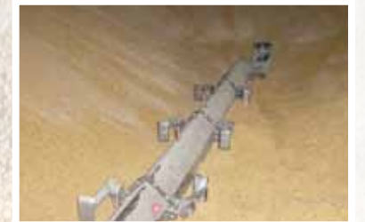
El diseño permite el barrido por el contorno del piso.