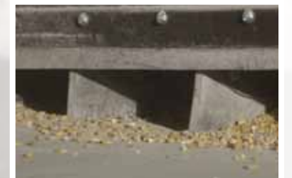
Mueve los granos en forma suave y pareja para recolectarlos con las paletas flexibles de caucho.