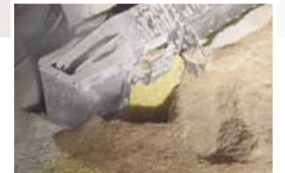
Acarrea la cantidad de granos que el trabajo requiera.

“La seguridad es la inquietud principal en nuestro trabajo. Es casi imposible lastimarse con el barredor Daay. Además de la seguridad, otra gran ventaja es el rendimiento. Con solo pasar dos veces alrededor del silo, recolecta casi todos los granos. Los demás barredores que probamos dejaban de 5 a 7 cm de granos en el suelo del silo que teníamos que juntar nosotros. Nos encantan estos nuevos barredores”.