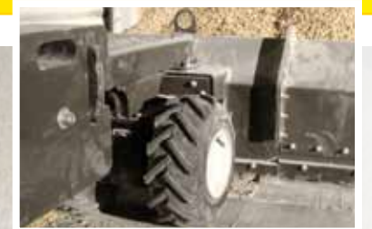
Los neumáticos estilo tractor están rellenos de espuma. El tamaño del neumático de tracción es de 13 x 5,00-6 Super Lug.